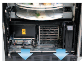
Grupo de frío compacto y de extracción rápida