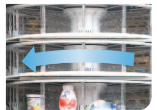
Apertura y cierre de los portillos automática