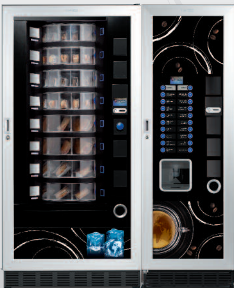
Easy 6000 GCD + Winning GCD