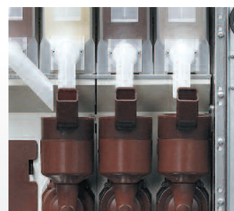
Mixer Fas ad alta resa con sistema auto aspirante