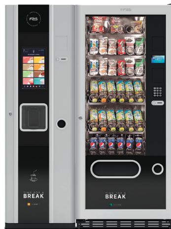
FAS 400 T + Young 170